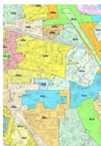
Du document d'urbanisme de la commune : POS ou PLU