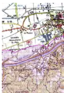
De la carte délimitant les espaces soumis à la réglementation du débroussaillage, éditée par la préfecture

L'identification des administrés concernés s'effectue donc à partir :