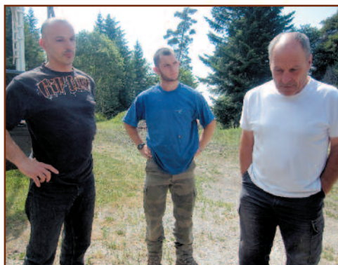
La Famille Belmon : 3 générations en forêt