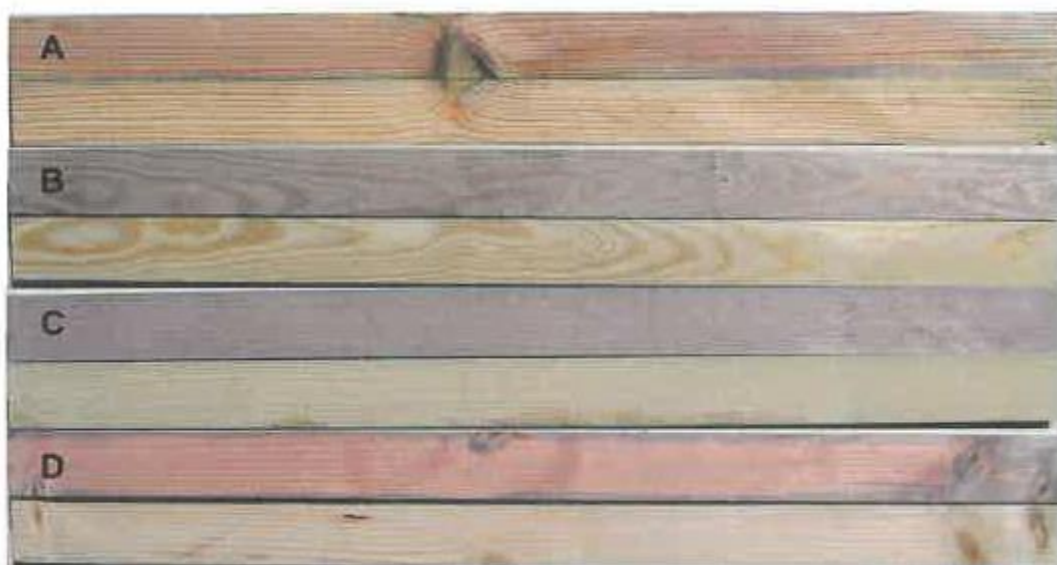
Figure 2 : Echantillons de Pin d'Alep après découpe dans le sens axial avant et après application du réactif chrome azurol S. (A) Duramen de Pin d'Alep. (B) Aubier de Pin d'Alep. (C) Témoin aubier de Pin sylvestre. (D) Témoin Epicea .

Les résultats des mesures après imprégnation sont regroupés dans le Tableau 1. En fonction des résultats obtenus, une classe d'imprégnabilité est définie selon les 4 classes décrites dans le document technique FD CEN/TR 14734 : 2005.