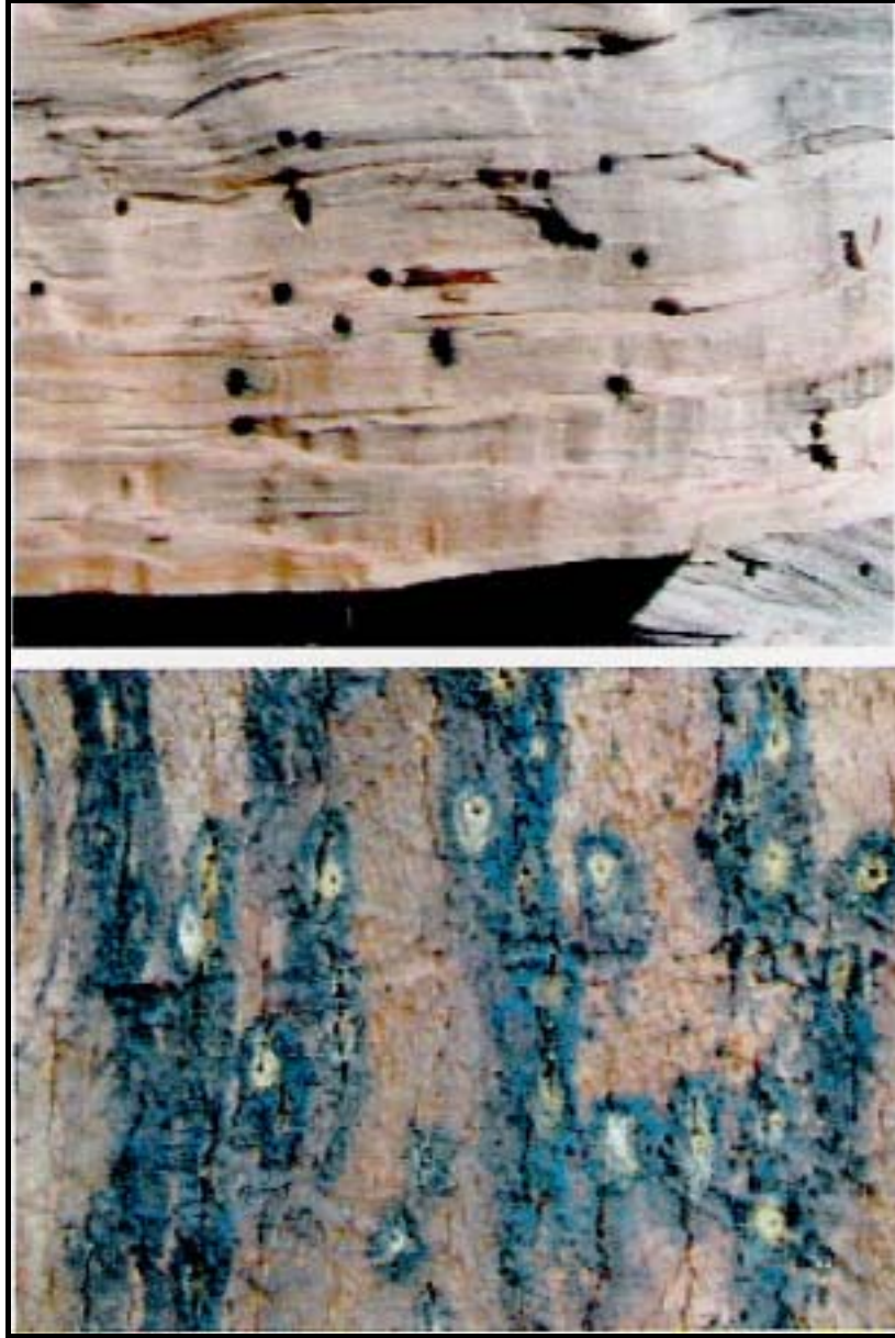
Trous de Platypus cylindrus F. et traces de sciure accompagnées d'écoulement de tanin