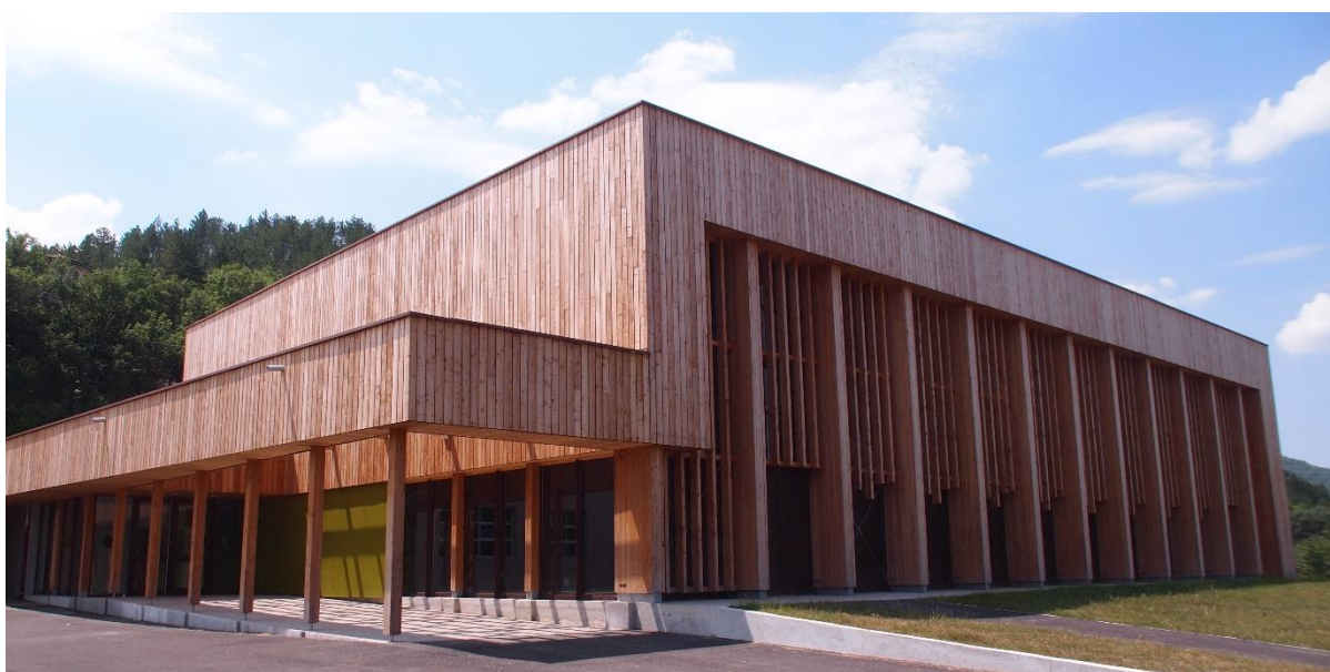
Ci-dessus : Gymnase du Lycée Agricole Digne Carmejane, en BOIS des ALPES™