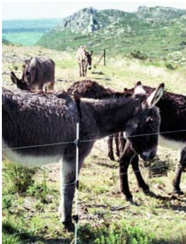
Anes utilisés pour consommer la végétation basse en vue de contrôler les combustibles

Les aménagements dans le cadre de la RTI ont plusieurs objectifs de gestion territoriale et sont entrepris en synergie avec Natura 2000, la Directive paysage et la charte du Parc naturel régional (qui prend en comp-