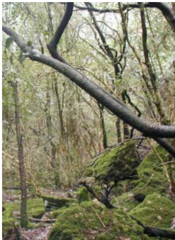
Forêt de fonds de vallon