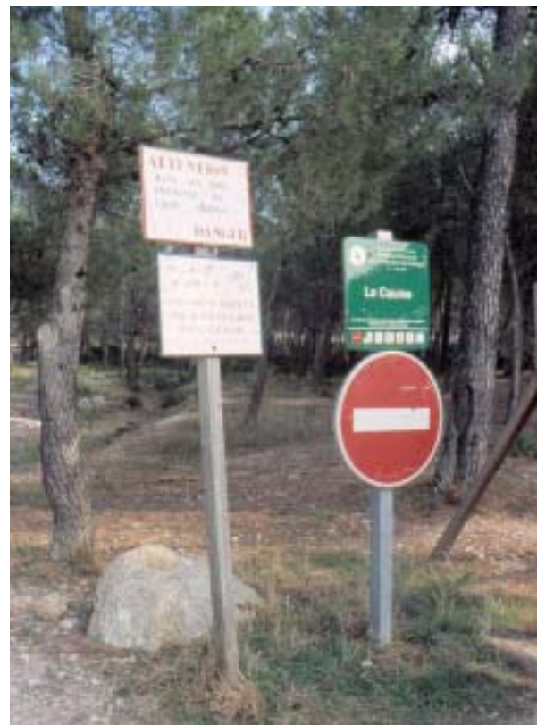
Parking paysager des Plaines