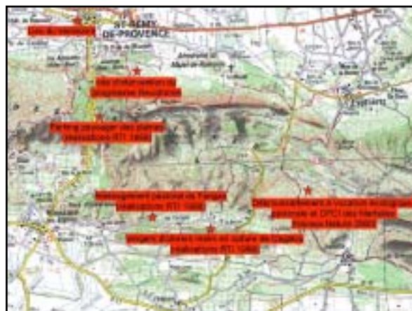
Localisation des sites visités

Le CRPF est néanmoins confronté à problème de