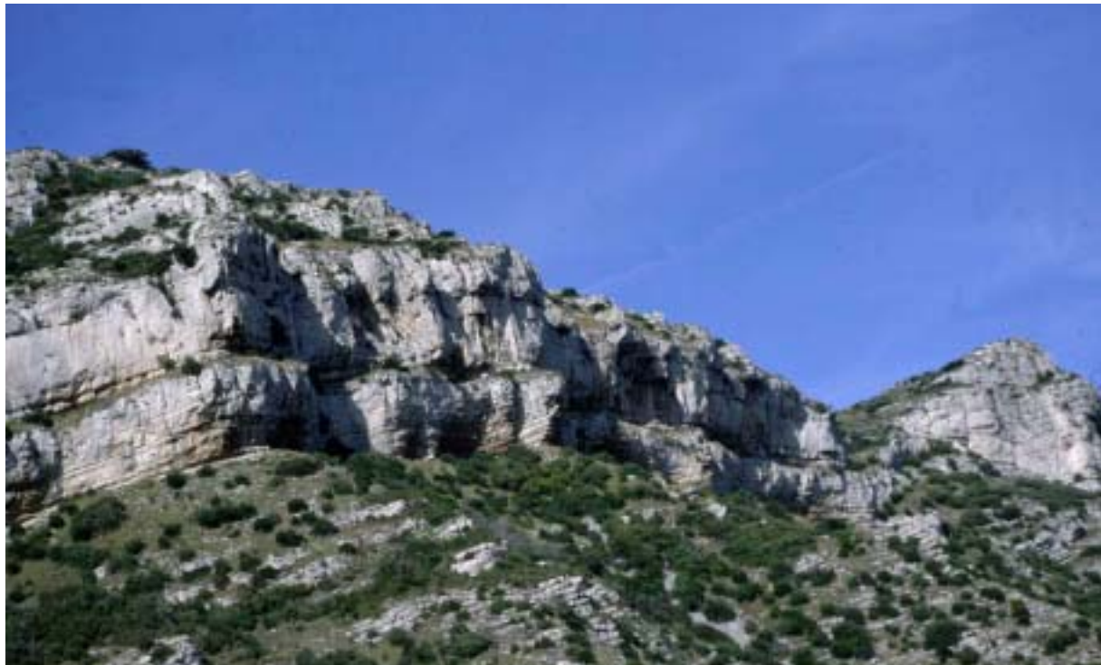
Falaises des Alpilles

12 à 18 % des causes de départ des feux sont liés à la foudre. Les travaux d'aménagement pourraient contribuer à préparer les forêts à recevoir les incendies tous