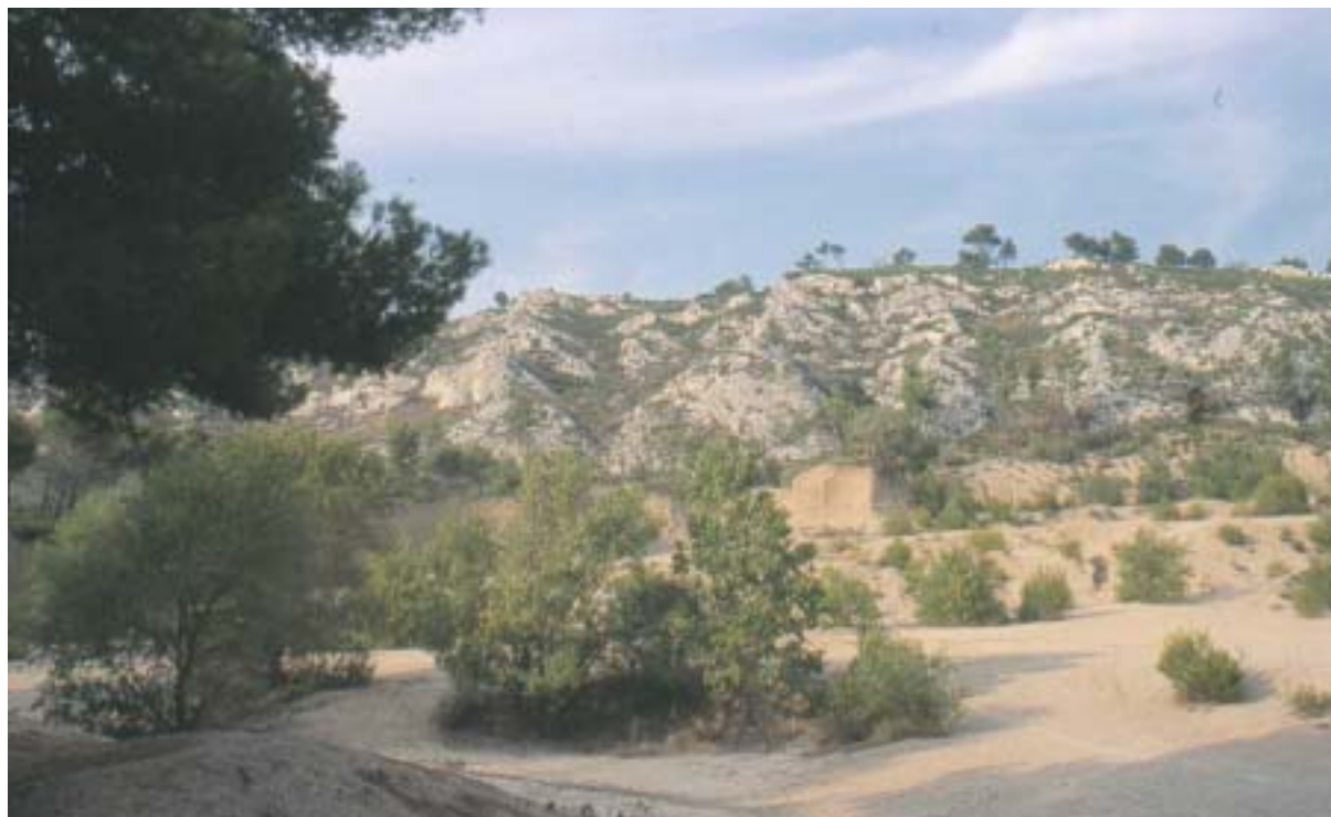
Paysage des Alpiilles

Nous ne passons pas pour le moment l'information par la télévision car nous pensons que certains incendiaires potentiels pourraient en profiter pour agir à ce moment. Nous contactons directement mairies. Nous utilisons également les radios comme média.