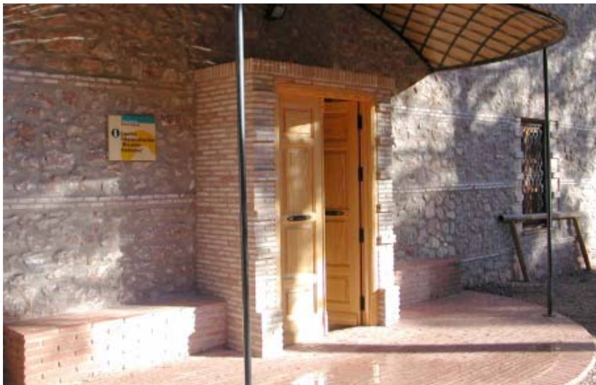
Entrée du centre Ricardo Cordonú - Parc régional de Sierra Espuña

La présence d'un massif emblématique doit avoir des retombés économiques sur les communes riveraines (restaurants, hôtels...). Cet aspect du tourisme n'a pas été évoqué. Il faut le prendre en compte.