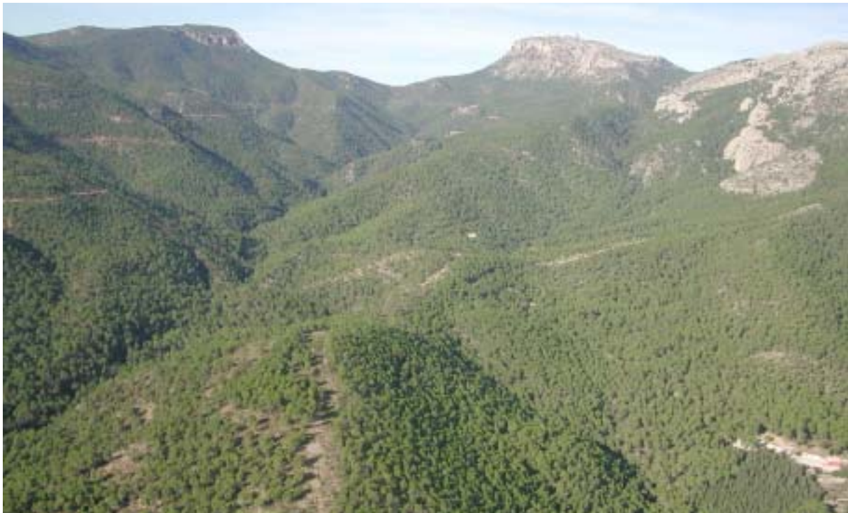
Vue aérienne du Parc régional de Sierra Espuña