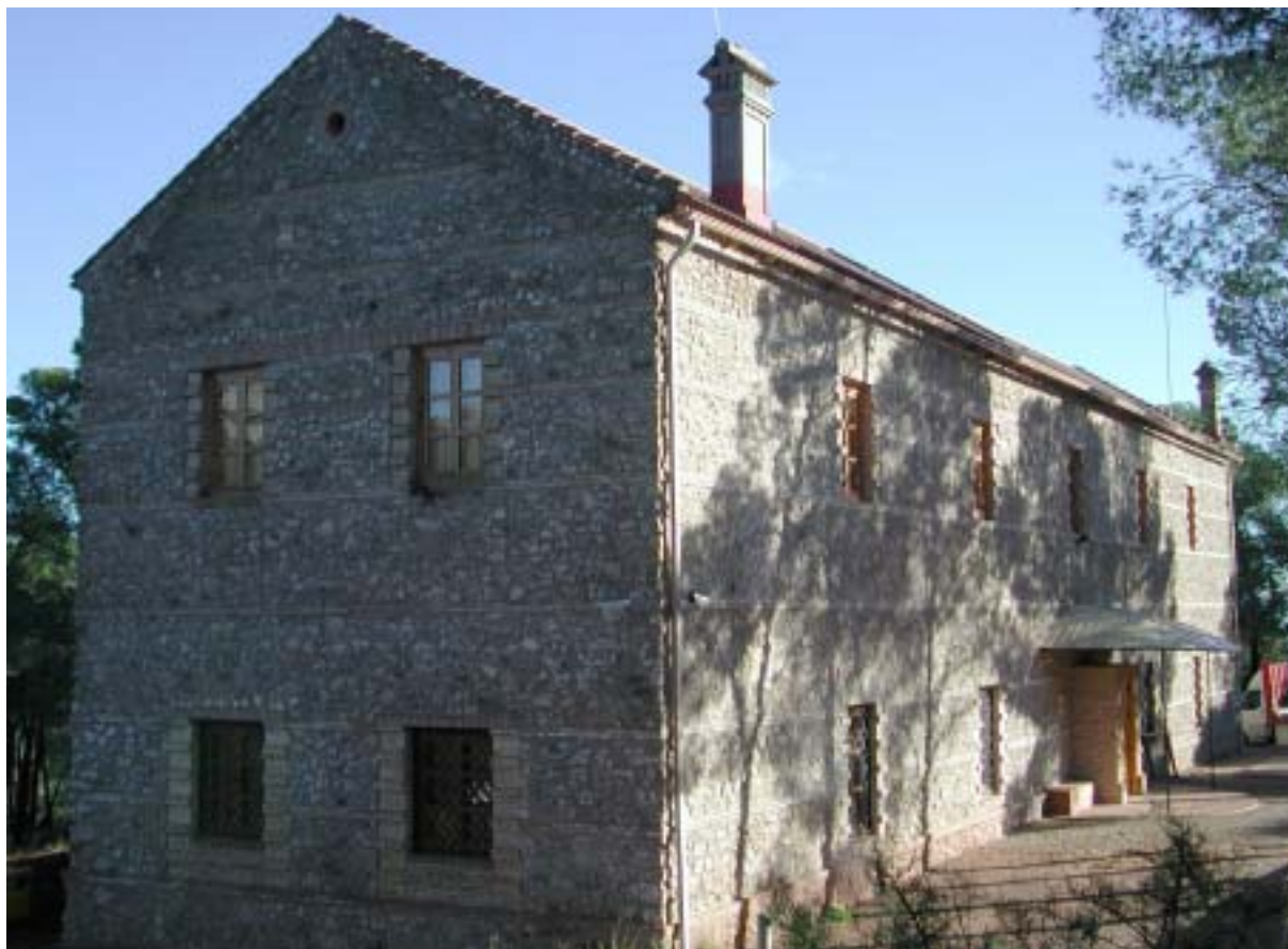
Centre d'information Ricardo Cordoniu - Parc régional de Sierra Espuña