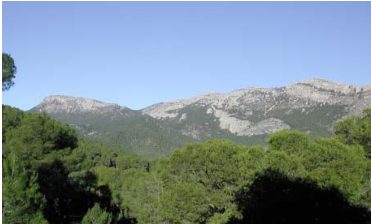
Sommets de Sierra Espuña

La chasse est gérée indépendamment du reste du parc, ce qui est problématique. Les mouflons à manchettes ont un grand intérêt esthétique et cynégétique,