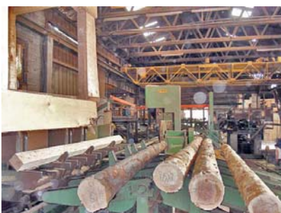
Ligne de sciage dans le Var.

Bien que fortement boisée avec 118 millions de m 3 de bois sur pied, la région Provence-Alpes-Côte d'Azur est peu exploitée sur le plan forestier. En 2013, l'exploitation forestière n'a ainsi prélevé que 25 % de l'accroissement annuel, soit 725 500 m 3 . L'année est marquée par un nouveau doublement de la récolte dédiée aux plaquettes bois énergie, et parallèlement, par une baisse de la récolte de bois de trituration. En aval, les scieries régionales, en majorité situées dans les départements alpins, ont produit 46 300 m 3 de sciages, soit comme en 2012, un niveau historiquement bas.