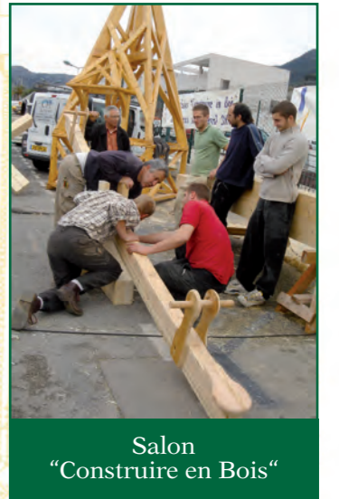
Salon "Construire en Bois"

Ce salon, unique dans les Alpes Maritimes, est le fruit d'un partenariat efficace entre la Mairie de La Trinité et FIBOIS 06-83, d'un engagement fort des partenaires institutionnels et financiers (État, Région, conseils généraux des Alpes Maritimes et du Var, Crédit Agricole). Mais il ne pourrait exister sans une forte mobilisation des adhérents. A cette occasion, une enquête de satisfaction a été réalisée auprès des exposants et des visiteurs. L'analyse des résultats de cette enquête a d'ores et déjà permis de préciser les points à améliorer pour la prochaine édition prévue en 2009.