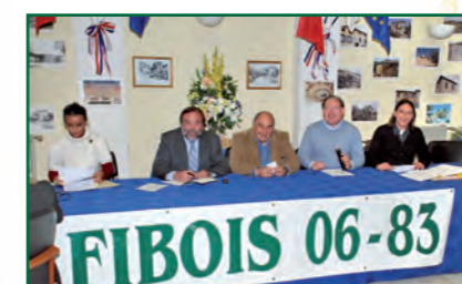
Des partenaires impliqués lors de l'assemblée générale

La dernière assemblée générale a été l'occasion d'élire un nouveau Conseil d'Administration et un nouveau bureau.