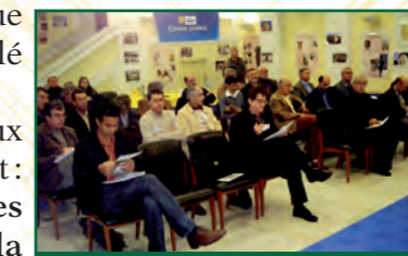
Lors du colloque, une assistance studieuse