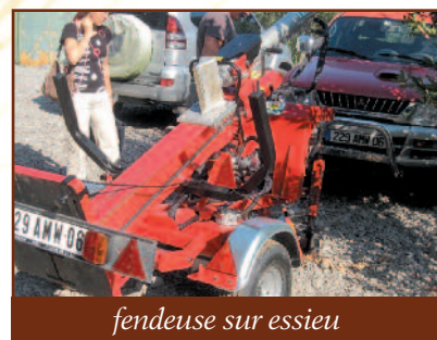
fendeuse sur essieu

Le nombre d'entreprises d'exploitation forestière est très bas dans nos départements. Malgré cela, ces investissements et la jeunesse des investisseurs sont pour l'interprofession, un signe que la filière investit sur l'avenir.