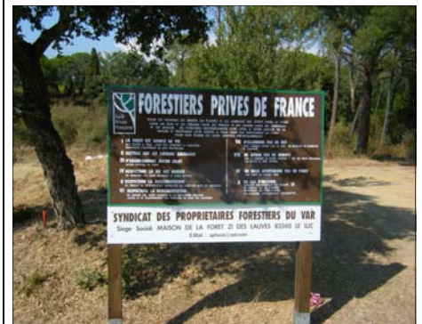
Feu à Marseille juillet 2009