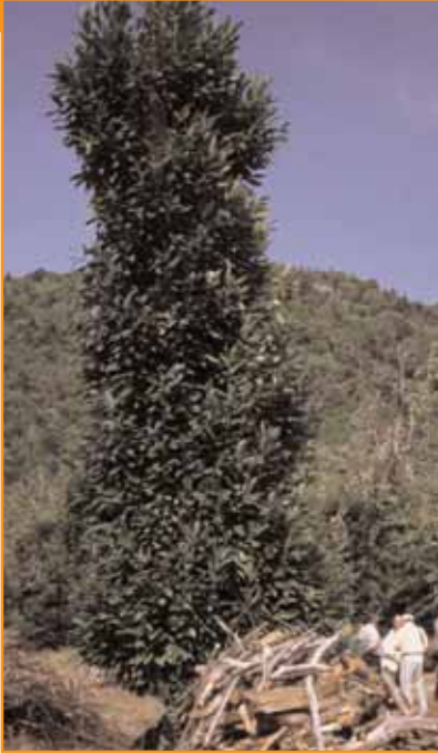
Ci-contre, l'allure provisoire d'un châtaignier taillé sévèrement dans le cadre de la rénovation de la châtaigneraie d'Annot.