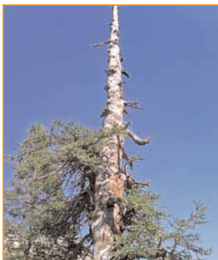
Ce vieux mélèze fixe du carbone depuis plus de 400 ans, ce qui vient d'être reconnu.

La mission des CRPF s'en trouve amendée : "les méthodes de sylviculture qu'ils encouragent à adopter doivent être compatibles, notamment, avec une bonne valorisation de la biomasse."