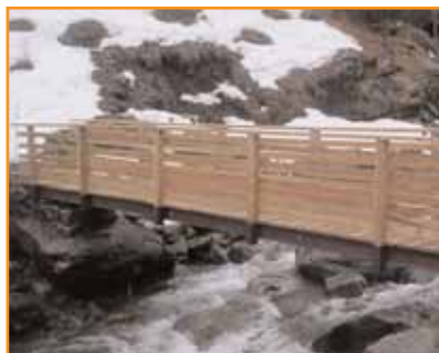
Les collectivités peuvent prescrire de nombreux ouvrages en bois tels que cette passerelle dans les Hautes-Alpes.

" Achetez vert ", tel s'intitule le manuel publié par la Commission européenne à destination des acheteurs publics à destination des acheteurs publics pour qu'ils intègrent des considérations environnementales lors de leurs commandes. Le bois y trouve toute sa place, du bureau à la construction d'édifices, à la condition qu'il soit certifié provenant de forêts gérées de manière durable (PEFC) ! Au lieu d'attribuer les lots au prix le plus bas, ce manuel incite à recourir à l'offre " économiquement la plus avantageuse " qui permet d'inclure des sous-critères notamment environnementaux. Il est donc possible de prévoir dans le cahier des charges des exigences conduisant à l'utilisation d'essences locales certifiées. ■