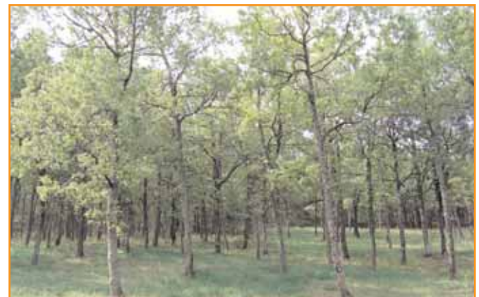
Une des premières parcelles éclaircies. La bonne répartition des tiges favorisent la pousse de l'herbe dont les moutons vont se régaler au début de l'été.

A.B. Je pense que ces expériences me conduisent à une vision globale de notre territoire. Je rappelle constamment l'intérêt de prendre en compte la forêt, souvent considérée comme un espace où il suffit de laisser faire la nature. Les forestiers doivent montrer la gestion qu'ils font et expliquer l'intérêt qu'elle présente pour eux comme pour la collectivité. ■