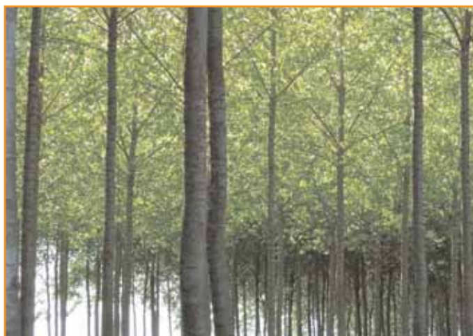
la plantation de peupliers doit être considérée comme une véritable culture. L'analyse du sol, le choix du clone et les entretiens sont décisifs.

A la mise en place de la Politique Agricole Commune, entre 1987 et 1992, des propriétaires de terres cultivées ont été amenés à les boiser pour des raisons patrimoniales, économiques et fiscales. Plusieurs ont eu recours à la plantation de peupliers pour assurer la viabilité économique, principalement dans le Vaucluse.