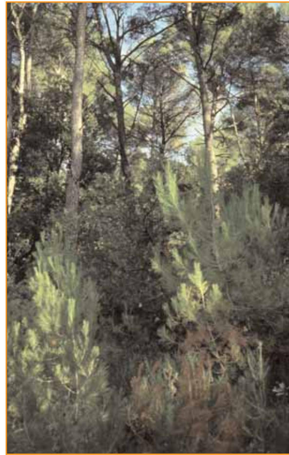
La conquête s'effectue frontalement à partir des peuplements existants, sans dépasser les cinquantes mètres.

Article inspiré par la fiche 730 d'Information Forêt, publication de l'Afocel