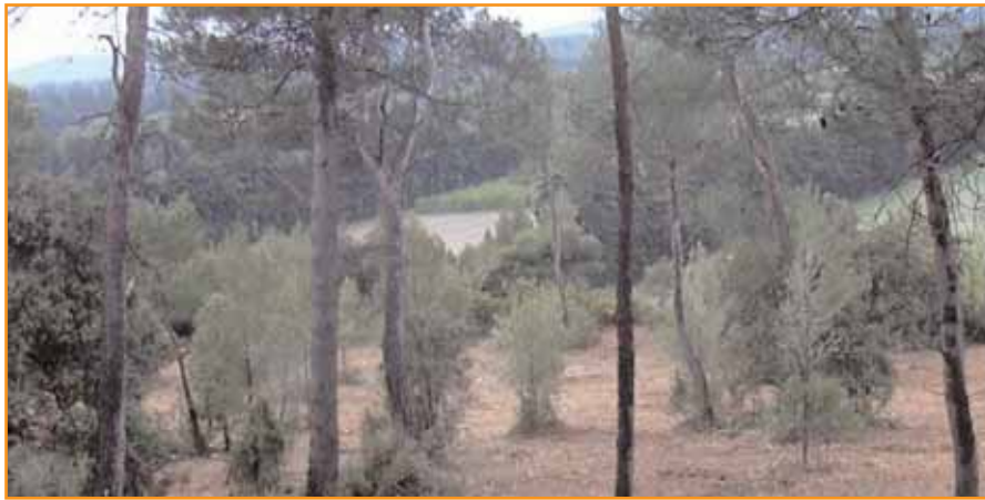
Cette coupe suivie de travaux, étudiée et programmée dans un plan de gestion discuté avec le propriétaire assure l'avenir de la forêt : régénération assurée sous les semenciers.

Le Plan Simple de Gestion est un bon outil, pour le propriétaire d'abord, pour la collectivité ensuite. Un travail conduit dans le Var (Provence Verte), en apporte des preuves.