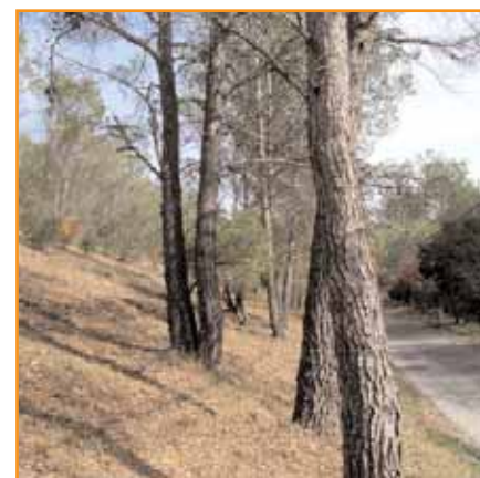
Les zones débroussaillées vont être élargies. Les travaux seront à la charge des collectivités. Les propriétaires devront les accepter.

L'art. 89 étend l'obligation de débroussaillage de DFCI jusqu'à 50 mètres au lieu de 20 mètres de part et d'autres des voies publiques ou des voies ouvertes à la circulation du public, pour celles qui sont répertoriées comme étant des équipements assurant la prévention des incendies par le plan départemental de prévention des incendies de forêt. Mais cette obligation incombe soit à l'Etat, soit aux collectivités territoriales intéressées, pas aux propriétaires forestiers, dont la seule obligation est de ne pas s'opposer à ce débroussaillage. ■