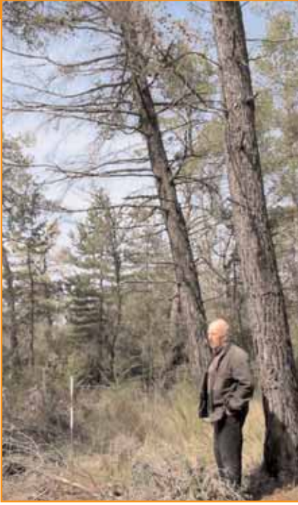
Un propriétaire du massif de ste Victoire qui a pu constater l'extension du pin d'Alep.

Le pin d'Alep vient de conquérir 60.000 ha en 25 ans (35% d'augmentation), bien que les derniers résultats montrent une tendance au ralentissement. L'analyse plus fine montre un changement dans la composition des peuplements.