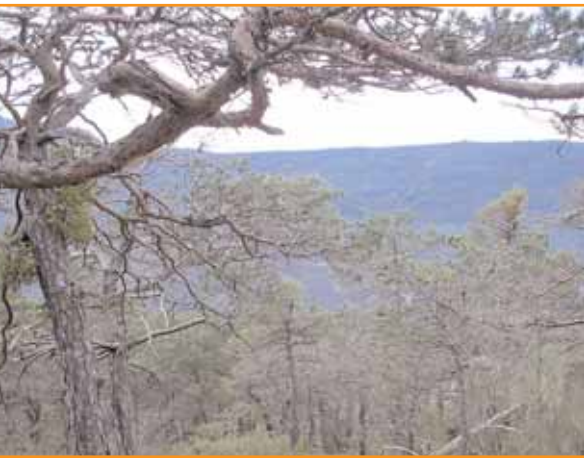
Petites aiguilles, couvert clair, oui, ce peuplement de pin sylvestre est en train de dépérir.

La canicule de 2003 a révélé la vulnérabilité du pin sylvestre et la résistance du pin d'Alep. Nos paysages peuvent donc évoluer avec parfois des conséquences néfastes.