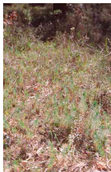
Semis de Pin d'Alep

La fiche suivante, liste les gestions recommandées et possibles après une première intervention.