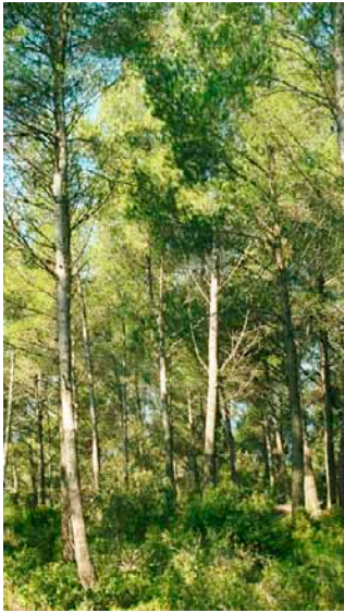
Une seconde éclaircie est nécessaire