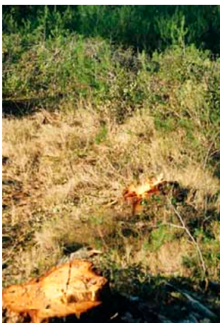
Coupe définitive sur régénération acquise