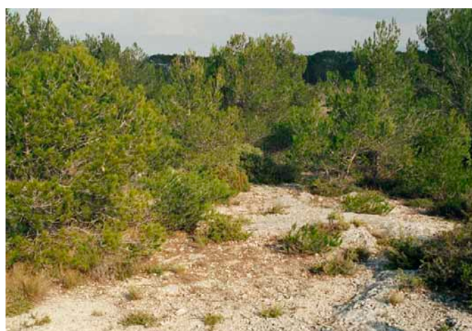
Forêt paraclimacique ou climax stationnel selon la définition donnée par Ph. DUCHAUFOR