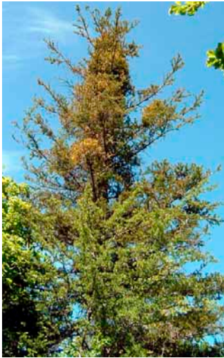
Le Gui provoque des dessèchements partiels du houppier, ce qui affecte la vigueur et la croissance des arbres

Trop d'incertitudes existent quant à la longévité et à la bonne santé (développement du Gui) des peuplements de Sapin sur ces stations