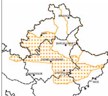
Localisation des Préalpes sèches

Classes de fertilité III et IV du Sapin dans les Alpes du Sud