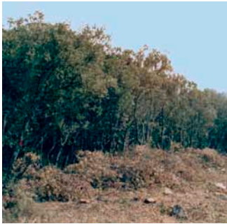
La coupe rajeunissement permet le renouvellement par voie végétative des taillis de Chêne vert et de Chêne pubescent (rejets)