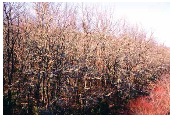
Jeune taillis issu de coupe de rajeunissement

Les taillis jeunes sont issus de coupes de rajeunissement, ou parfois d'incendie.