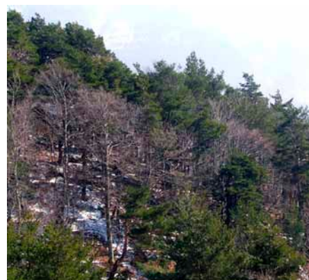
Le mélange de Pin sylvestre et de Hêtre n'est pas naturellement pérenne. La dynamique de végétation conduit à la domination du Hêtre

En général il s'agit de peuplements productifs présentant un fort volume sur pied.