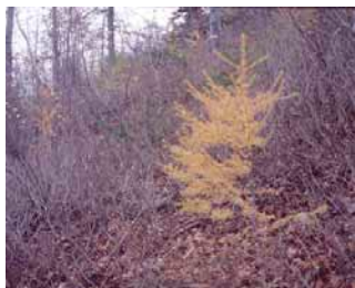
CRPF - Avignon (05)

MÉLÈZE ET HÊTRE UNE ASSOCIATION PROFITABLE Le Mélèze qui domine, bénéficie de la pleine lumière et de l'effet de gainage du Hêtre. Le Hêtre n'est pas gêné par l'ombrage léger du Mélèze