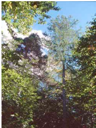
CRPF - Champsaur (05)

MÉLÈZE ET HÊTRE UNE ASSOCIATION PROFITABLE Le Mélèze qui domine, bénéficie de la pleine lumière et de l'effet de gainage du Hêtre. Le Hêtre n'est pas gêné par l'ombrage léger du Mélèze