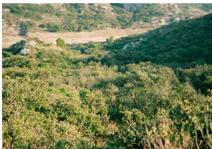
Le « taillis à croissance réduite » de Chêne vert présente un intérêt environnemental important (érosion, faune et flore)

Il ne présente guère d'intérêt sylvicole (potentiel très faible), mais sa vocation environnementale est importante.