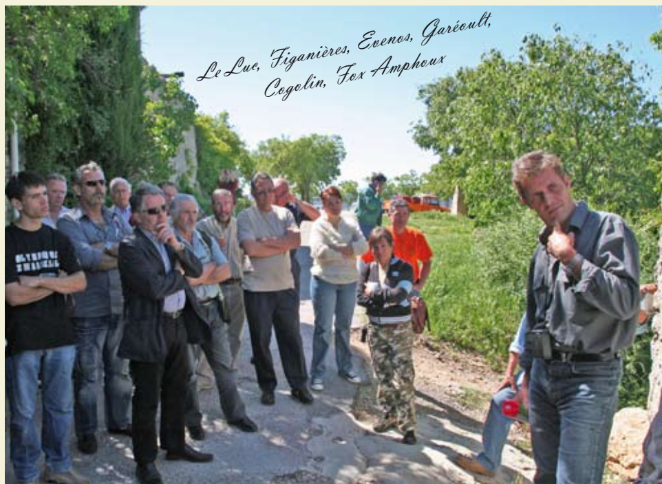
Visite de terrain lors de la formation débroussaillage de Fox Amphoux

Ces ateliers se sont déroulés en trois temps : la présentation du DVD "Débroussaillage réglementaire" et de son utilisation, la présentation de la réglementation et de ses applications puis des visites de terrain qui ont permis de rencontrer des propriétaires et d'appréhender leurs difficultés.