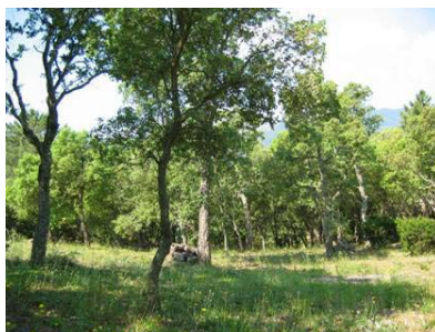
Travaux entièrement réalisés