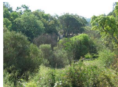
Travaux n'ayant pas débuté