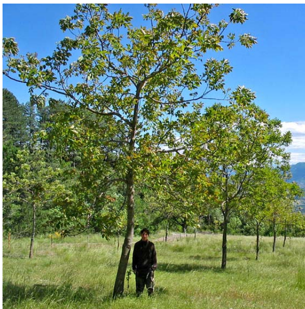
Plantation de noyer commun de 14 ans