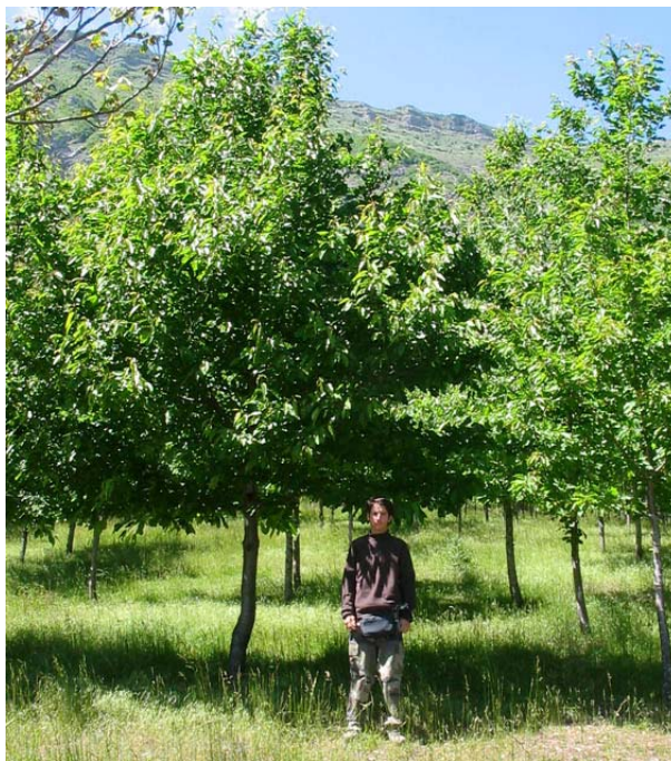
Plantation de Merisier de 14 ans