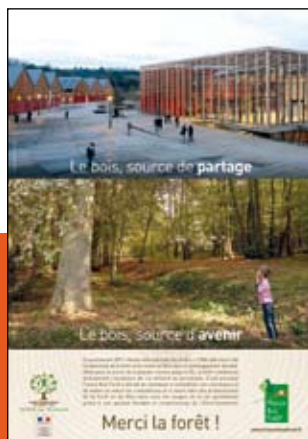
Annnonce dédiée aux élus locaux et territoriaux