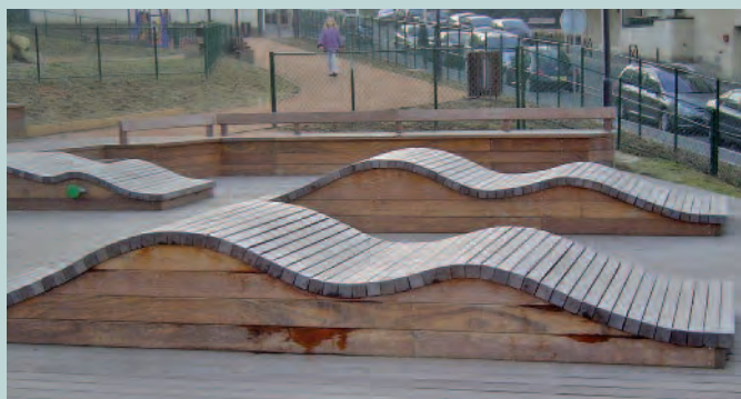
Bike-Park en ville