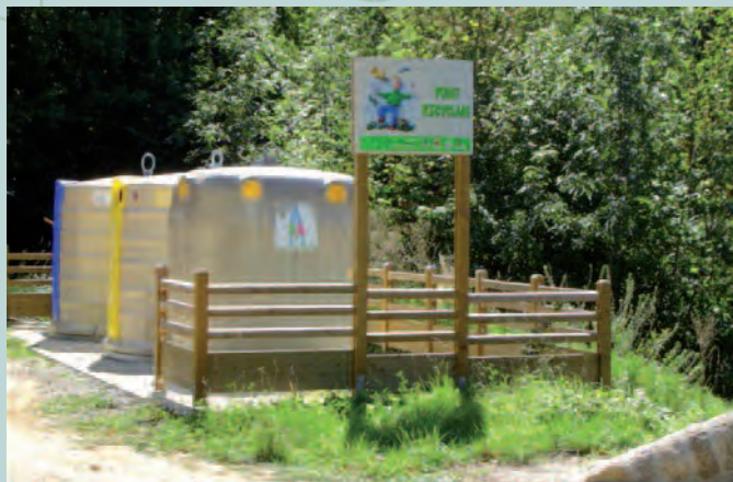
Barrière et panneau pour tri sélectif