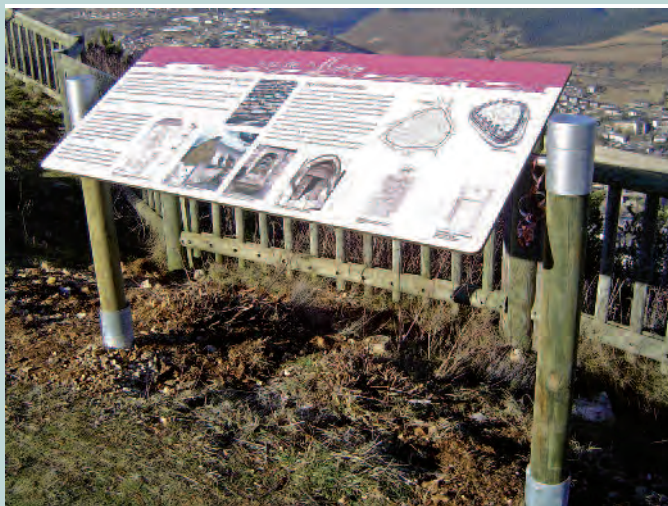
Panneau d'information pour sentier