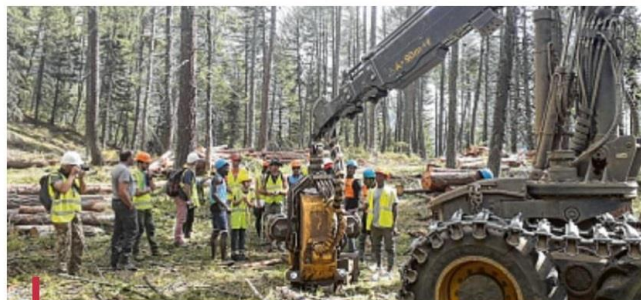
La rencontre avec le conducteur d'une abatteuse sur le chantier de La Pare et les explications des intervenants ont retenu l'attention des participants.

"Un chantier peut sembler sur l'instant chaotique mais l'exploitant est tenu de respecter des règles strictes et de laisser la