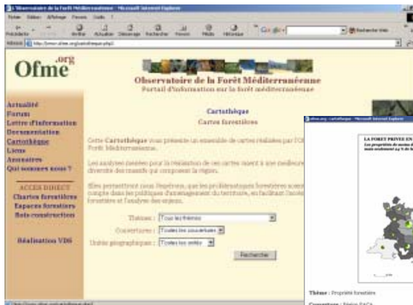
Page d'accueil de la cartothèque

Cette cartothèque est maintenant alimentée par les cartes réalisées grâce à la base de données forestière gérée par l'Observatoire dans le cadre des différentes études, formations ou besoins spécifiques.