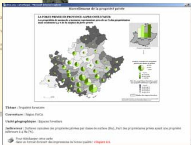
Exemple d'une fenêtre carte