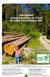
L'affiche pour les communes « Commune engagée dans la certification PEFC »