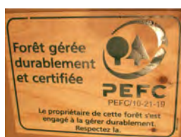
Les panneaux en bois PEFC proposés aux propriétaires certifiés