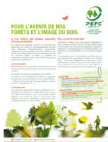
La documentation pour les propriétaires, les exploitants et les entreprises